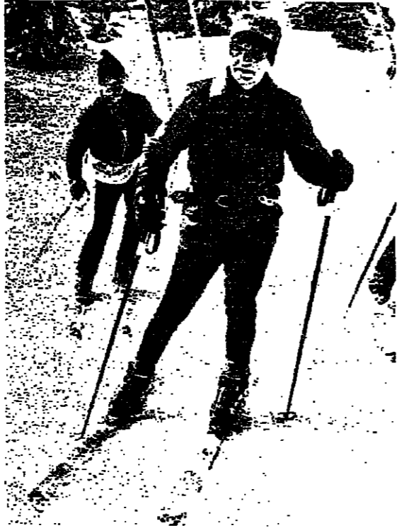
شاه إيران يتراجم